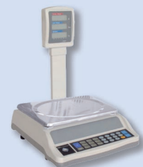
Anzeige auf Stativ

UNIVERSALWAAGEN Preiswerte Präzision - Paketwaagen - Hängewaagen - Kompaktwaagen - Vieh-Selbstbauwaagen - Personenwaagen - Küchenwaagen - Sonderwaagen MEDIZINALWAAGEN Personenwaagen - Säuglingswaagen - Betten-Sitzwaagen - Veterinärwaagen LABORWAAGEN Analysewaagen - Präzisionswaagen - Apothekerwaagen - Juwelierwaagen - Komparatorwaagen - Feuchtebestimmung INDUSTRIEWAAGEN Fahrzeugwaagen - Bodenwaagen - Palettenwaagen - Pultwaagen - Zählwaagen MOBILE WAAGEN Handhubwaagen - Staplerwaagen - Kranwaagen - Achslastwiegeflächen LADENWAAGEN WAAGENBAUSÄTZE ZUBEHÖR